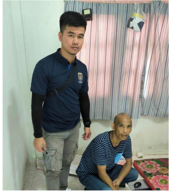
7.ปิดล้อมตรวจค้นสถานีตำรวจภูธรโพนพิสัย งานสืบสวน สภ.โพนพิสัย เป้าหมายการปฏิบัติ 4 ราย ผลการปฏิบัติ (1-31 ธ.ค. 66) 4 ราย บรรลุเป้า ๓ ราย