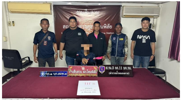
หมายจับ / เป้าหมายจับที่ ภ.จว.มอ.บ.หมาย 2 ราย / ผลการจับกุมประจำเดือน จับ 2 ราย